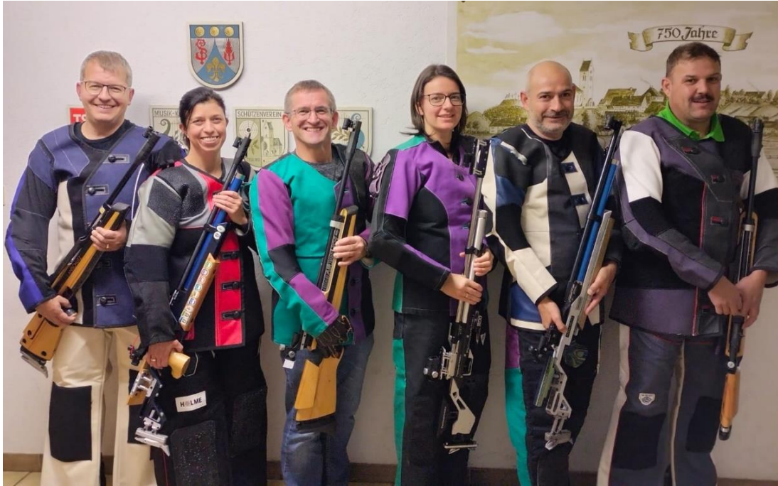
Aufstieg der Luftgewehr-Mannschaft in die Gauberliga