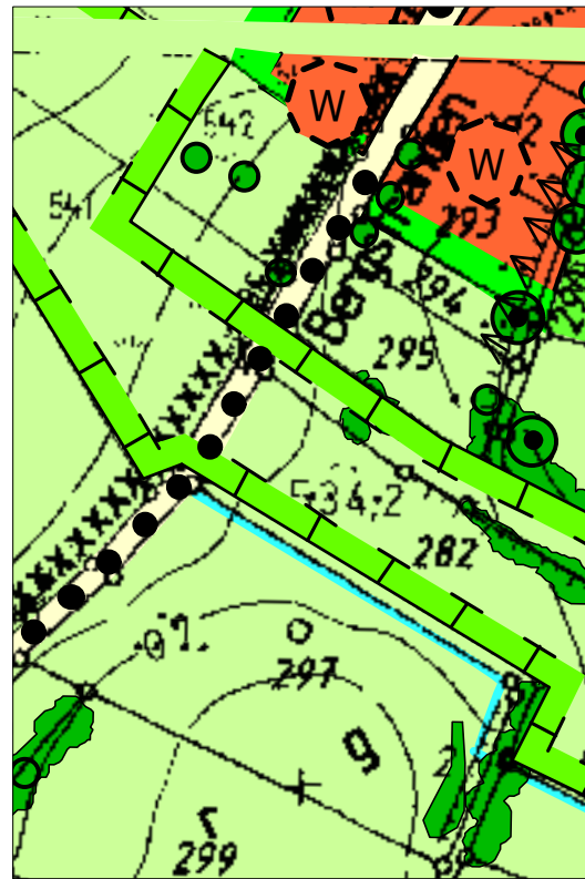
Digitale Flurkarte © 2023 Bayerische Vermessungsverwaltung